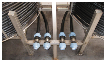
Forberedt for direkte tilslutning af hovedledninger.