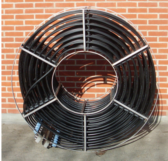
Varmeoptager til varmeoptagelse nedsænket i sø. Oprullet med 8x20m slange.