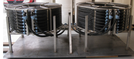
2 stk. varmeoptagere på ramme til nedsækning i sø.