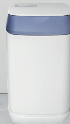
AQUA SOFT 9