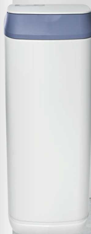
AQUA SOFT 15